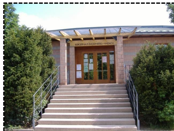
Eingang des Bürgerhaus Buckneberg-Haidach